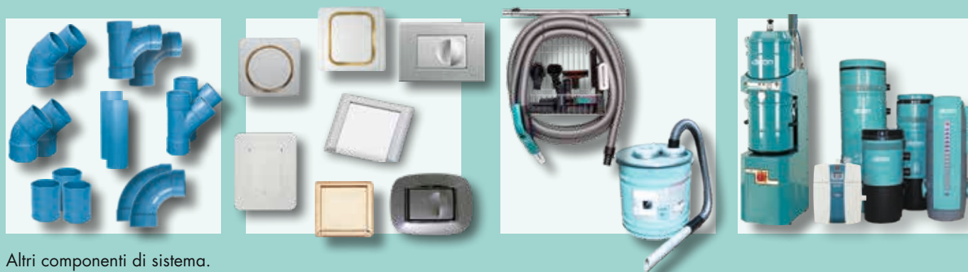
Altri componenti di sistema.

I migliori studi tecnici internazionali, quando chiamati a progettare un impianto aspirapolvere professionale dove l'affidabilità dei prodotti e la cura del particolare tecnico è determinante, scelgono Disan.