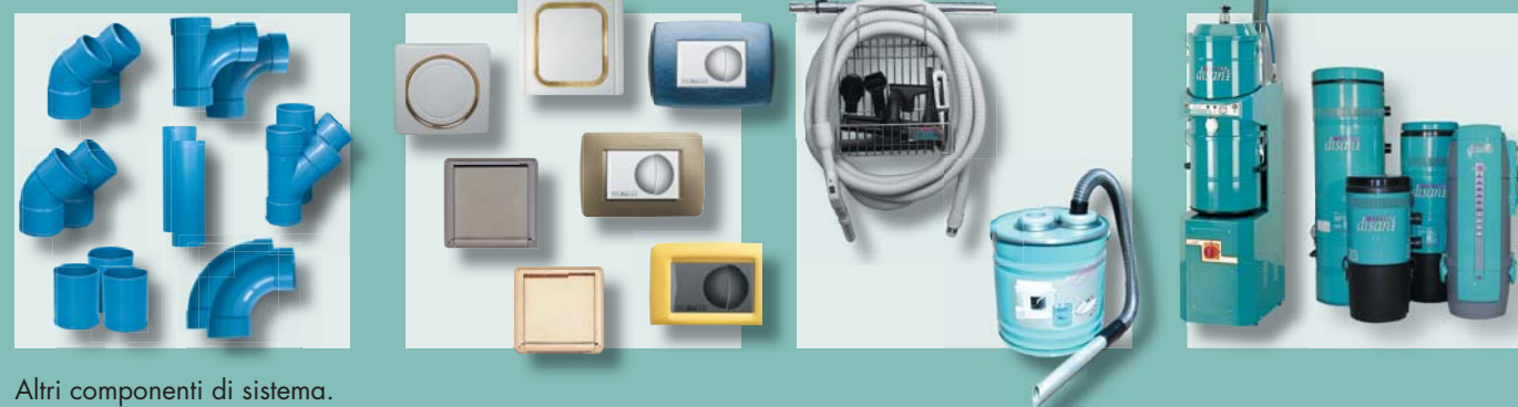
Altri componenti di sistema.

I migliori studi tecnici internazionali, quando chiamati a progettare un impianto aspirapolvere professionale dove l'affidabilità dei prodotti e la cura del particolare tecnico è determinante, scelgono Disan.