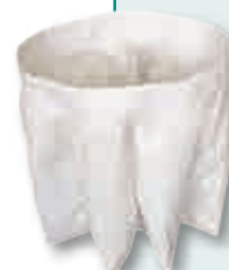
Teflon® Filter, Industrieklasse "M" Art. Nr. ER244