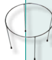
Tütenhalter Art. Nr. IS95